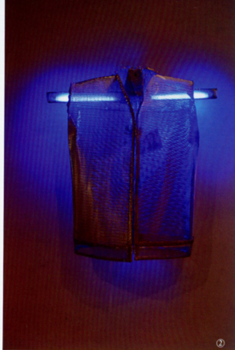
②《空虚》 汤 泯