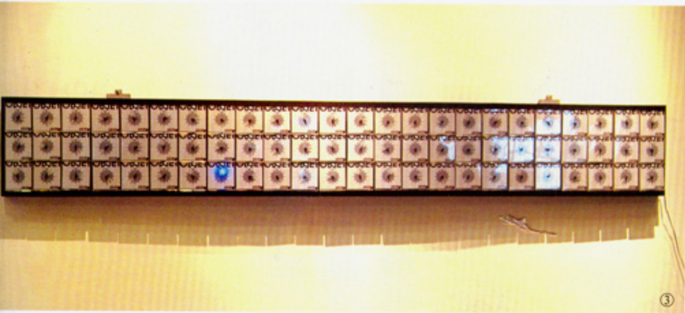
③《5 VS 300》高洪翔