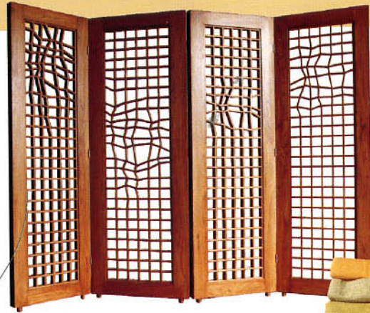
东风破——屏风 (木码设计)