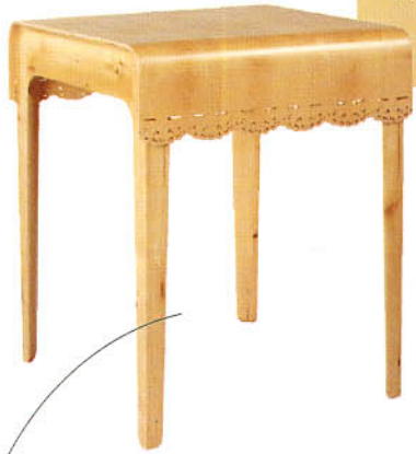
蕾丝边桌 (日本Jin Kuramoto)

在家居空间中，家具是最直接和人发生关系的物品，兼顾实用主义和审美情感。古典？简约？后现代？家具的外在形式寄托了设计师的情感，而消费者的选择是与之对应的共鸣。