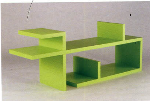
栅——变形椅 (木码设计)