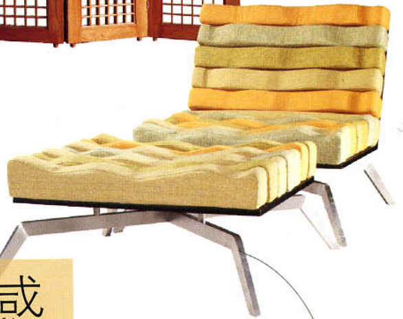
躺椅 (意大利Lui Laurence)